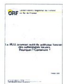
Pascale d'Anfray-Legendre Dans le cadre du CAUE 78

Participation au groupe de travail et de réflexion sur les thèmes suivants : - Comment encourager l'intensification urbaine ? - Comment maîtriser le développement des bourgs, villages et hameaux ?