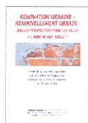
Pascale d'Anfray-Legendre et al.

La clôture participe à la qualité des lieux. Cette brochure s'adresse à l'ensemble des intervenants du cadre bâti, des responsables des collectivités territoriales, des maîtres d'œuvre et des particuliers qui rénovent ou construisent. L'objet de cette publication est d'apporter une aide technique et qualitative à tout porteur de projet architectural et urbain comportant une clôture.