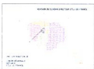
Pascale d'Anfray-Legendre et al. Dans le cadre du CAUE 78

Cette petite brochure destinée aux élus précise l'intérêt de ce nouvel outil de projet. Elle donne des indications sur les thèmes traités, la place des orientations d'aménagement dans le document d'urbanisme, leur articulation avec les autres éléments du document. Elle s'appuie sur des exemples illustrés (ouvrage collectif).